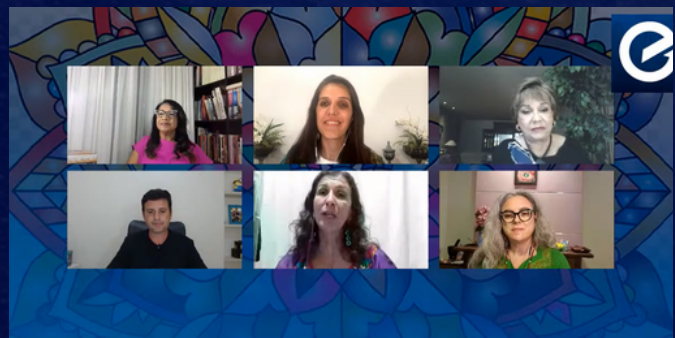
Semana Holística Eventos em Foco

Você tem grandes riquezas e eu posso dar todo o foco que seu projeto necessita para te auxiliar a transformar o seu conhecimento, produto ou serviço, em um grande evento, inclusive virtual.